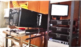
Christie 4220 (4K) Digital Projector

চলচ্চিত্র নির্মাণের পর বিভিন্ন পেক্সাগুহে প্রদর্শনের জন্য Digital Cinema Package (DCP) তৈরি করার প্রযুক্তি এফডিসিতে বিদ্যমান। DCP-এর সাথে KDM (Key Delivery Message) সংযোজন করে পাইরেসি রোধ করা সম্ভব। ফলে নির্মাতাগণ অধিকতর কৃতিমুক্ত থাকবেন। Christie 4220 প্রজেক্টরের মাধ্যমে এফডিসিতে ডিসিপি সিনেমা দেখার সুযোগ রয়েছে।