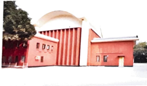
স্যুটিং ফোর # ২

বঙ্গবন্ধু শেখ মুজিব ফিল্ম সিটি: কবিরপুরে ১০৫.৫৬৭ একর জমির উপর বঙ্গবন্ধু শেখ মুজিব ফিল্ম সিটিতে আরো আকর্ষণীয় স্যুটিং স্পট হিসাবে গড়ে তোলার লক্ষ্যে একটি প্রকল্পের কাজ সমাপ্ত হয়েছে। ছবির বিভিন্ন লোকেশন তৈরির জন্য একটি চমৎকার উপযোগী জায়গা হিসাবে ইতোমধ্যে বঙ্গবন্ধু শেখ মুজিব ফিল্ম সিটি চলচ্চিত্র নির্মাতাদের কাছে অত্যন্ত আকর্ষণীয় হয়ে উঠেছে। প্রথম পর্যায়ে উক্ত ফিল্ম সিটিতে নিম্নোক্ত স্যুটিং স্পট তৈরী আছে: