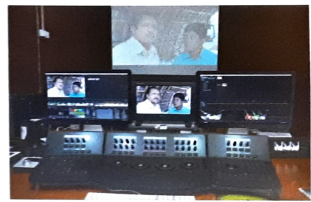
কালার কারেকশন স্যুট

ক্যামেরায় ধারণকৃত চিত্রকে (2/4/8K Raw Stock) পর্দায় প্রক্ষেপণের পূর্বে নান্দনিকরণ - এ ফুটিয়ে তোলার জন্য বিখ্যাত DaVinci Resolve Advance Control কালার কারেকশন মেশিনে এফডিসিতে স্থাপন করা হয়েছে যা চিত্র নির্মাতাদের মাঝে নাকন সাজা জাগিয়েছে। অত্যাধুনিক Software Resolve ব্যবহার করে কালারের বিভিন্ন আলিকে কাজ করা হয়।