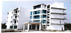
বঙ্গবন্ধু শেখ মুজিব ফিল্ম সিটির স্যুটিং অবকাঠামোর অংশ বিশেষ