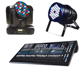
লাইট ও কনসোল