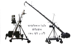
আমেরিকার বৈতরি জীমিজীব (৪০ ফুট) - ১টি