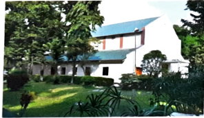
স্যুটিং ফোর # ১