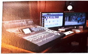
ডাবিং ও মিক্সিং যন্ত্রপাতি